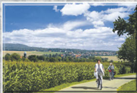
Blick auf Lohmen