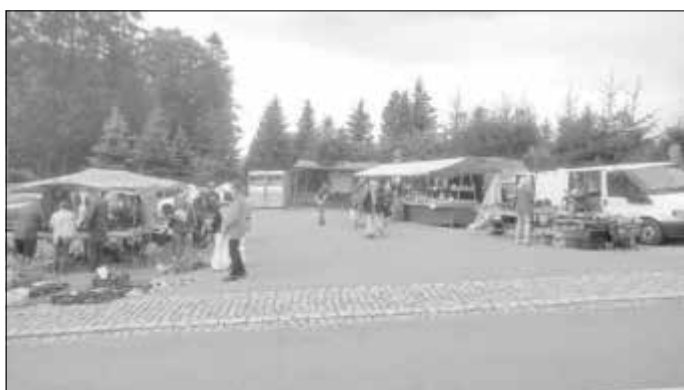
Naturmarkt Anbieter unterer Parkplatz am Abenteuerspielplatz

Die Landfrauen aus Lindenau stellten vor Ort Butter und Buttermilch her. Auch an unserem Stand des Landschaftspflegeverband West erzgebirge e. V., zeigten die Besucher großes Interesse an Broschüren und Flyern zu Wandertouren, Infomaterial für Kinder und dem neuerschienenen Heft „Lebendige Vielfalt im West erzgebirge“, wo aktuelle Projekte des NABU Aue-Schwarzenberg und LPV West erzgebirge e. V. in der Region vorgestellt werden.