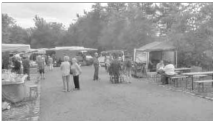
Naturmarkt Anbieter in der Buswendeschleife

Ein gemütliches Beisammensein am Abend rundete die gelungene Veranstaltung ab. Für die Herbstschau haben wir uns, die Mitglieder des Kleintierzüchtervereins, schon ein paar neue Ideen überlegt um unsere Schau wieder attraktiver zu gestalten, wir laden Sie dazu am 02. und 03.11.2019 herzlich ein.