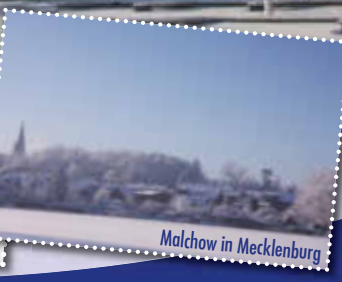
Malchow in Mecklenburg

Tel: 039932-825201 · info@ferienkontor-mv.de stadthafen-malchow.com