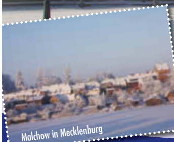
Malchow in Mecklenburg