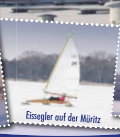
Eissegler auf der Müritz