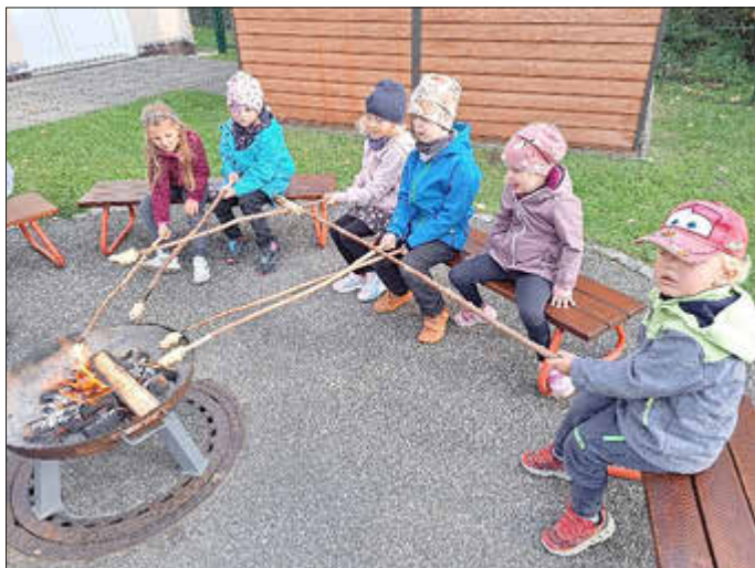
Ob süß oder deftig – Stockbrot schmeckt immer

Mit Tanz und viel Musik eroberten die Kinder ihn im Nu. Dazu gab es leckeres Stockbrot und die Kinder erlebten einen tollen Tag.