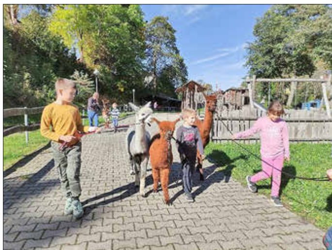
Spaziergang mit Alpakas

Zwei Wochen voller Abenteuer, auf die wir uns riesig gefreut haben, sind wie im Flug vergangen. Hier möchten wir euch ein paar unserer Highlights erzählen.