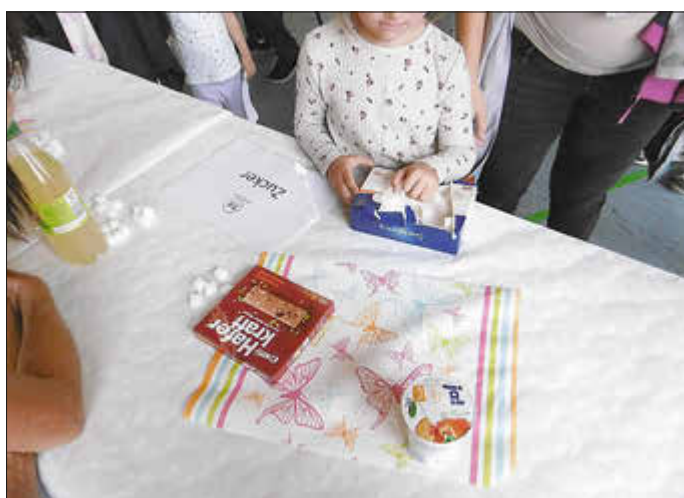
Wie viele Stücke Würfelzucker befinden sich versteckt in unserer Nahrung?

Alle, die an diesem Nachmittag Appetit, Hunger und/oder Durst bekommen haben, waren im „Café der gesunden Kost“ genau richtig: Möhren-, Apfel- und Kartoffelkuchen, Hafer-Bananenkekse, hauseigene Kräuterbutter auf Brot, Gemüsesticks mit verschiedenen Dips, Wraps und gesunde Getränke luden zum Probieren und Verweilen ein. Das gesamte Angebot wurde in den Stunden vor der Veranstaltung von den Kindern in Krippe, Kindergarten und Hort gemeinsam mit ihren Erzieherinnen zubereitet, geschnitten und gebacken. Das Ergebnis konnte sich nicht nur sehen lassen, sondern war auch sehr schmackhaft.