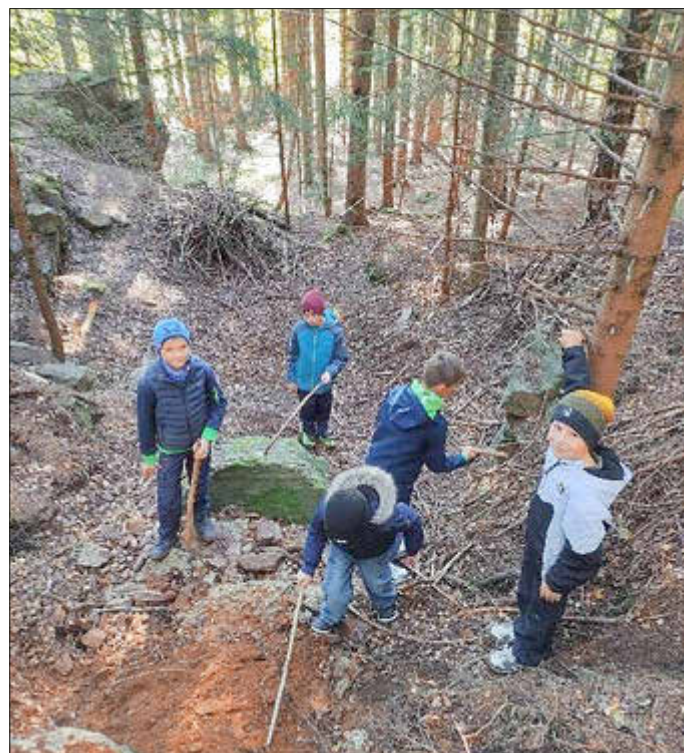
Spielen im Wald