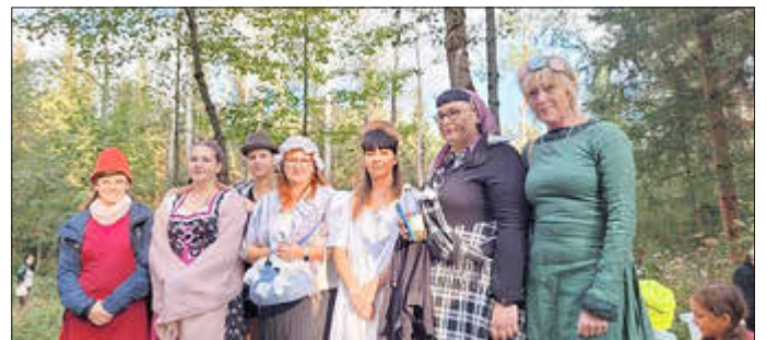
Viele Märchenfiguren warteten im Wald

Und tatsächlich wurden die Kinder fündig. Mit den Märchenfiguren zusammen eroberten sie den Wald und am Ende des Rundwanderweges warteten leckere Bratwürste auf die hungrigen Wanderer.