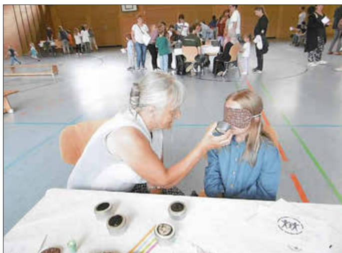
an der Station „Riechen“