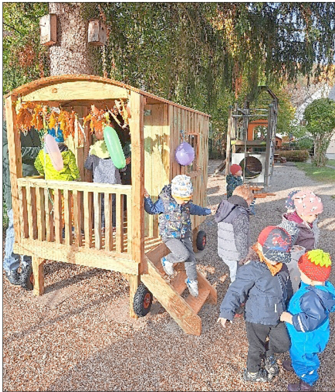
Die Kinder bekommen den neuen Bauwagen und nehmen ihn in Besitz

Auch im Herbst wartete ein Highlight auf die Kinder der Kita. Rumpelstilzchen kam zu Besuch und weihte den neu erworbenen Bauwagen im Garten ein.