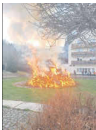
Auch die Hotelgäste waren voller Begeisterung