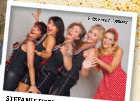
STEFANIE HERTEL & die Dirndrock Band