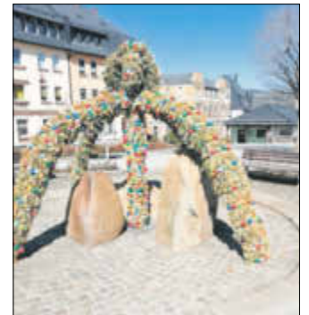
Osterbrunnen in Lauter

Ein kleines Picknick bei Sonnenschein bildete den Höhepunkt der Ausfahrt. Das wurde natürlich sehr genossen.