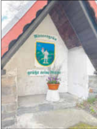
Die Ortseingangshäuschen neu bepflanzt....