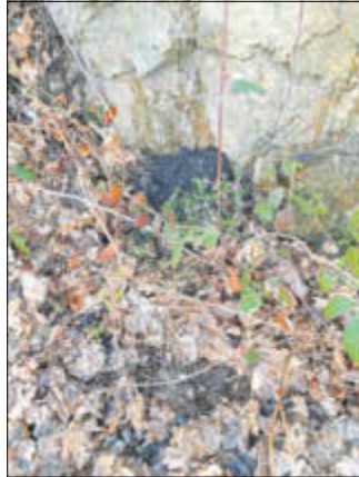
.. und leider auch die zerstörte Arbeit am Wegesrand