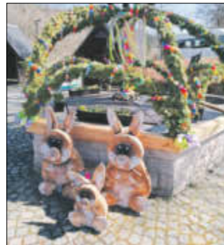
Osterbrunnen in Rittersgrün