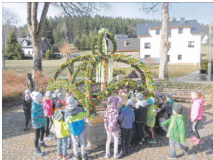
Ein Besuch des tollen Osterbrunnens war dieses Jahr Pflicht.

So vergingen die Tage bis zum Osterfest wie im Fluge. Um am Gründonnerstag dem Osterhasen genügend Zeit zum Verstecken der Osternester einzuräumen, besuchten wir mit den Kindern zunächst unseren Rittersgrüner Osterbrunnen, der in diesem Jahr ein absolutes Schmuckstück in der Ortsmitte darstellte. Anschließend begann die große Suche in unserem Außenbengelände, bei der am Ende ein jedes Kind sein Osternest in den Händen halten konnte.