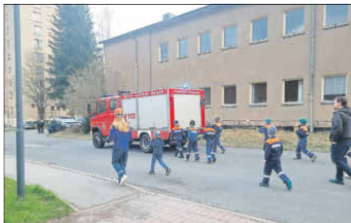
Absicherung des Fackelumzuges durch die Jugendfeuerwehr