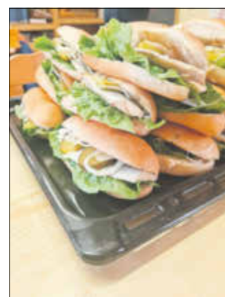
Wir waren zuerst vergriffen.