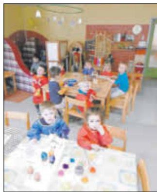
Ein Blick in die Osterwerkstatt.

Viele Kinder haben bereits zu Hause ihren Eltern beim Ausblasen der Eier zugesehen oder geholfen, die sie anschließend bei uns in der Kita farbenfroh gestalten durften. Auch unsere verschiedenen Bastelangebote wurden gern angenommen und mit Ideenreichtum umgesetzt.