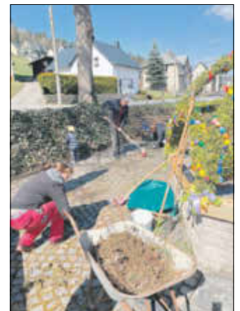
stellvertretend für die vielen Einsätze: Arbeiten am Pyramidenstandort

Die Freiwillige Feuerwehr und der Förderverein Feuerwehr erneuerten einen maroden Gartenzaun in Arnoldshammer und ertüchtigten die Löschwasserentnahmestelle aus dem Pöhlwasser. Mitglieder der FWG WIR und des FV Fuchsjagd kümmerten sich um die Pflege des Bewuchses vor der Turnhalle und an der Ortspyramide, der Sportverein war am Sportplatz und der Schanze aktiv, die Chronisten pflegten das Anton-Günther-Denkmal und das Denkmal für die Opfer des Todesmarsches. Im Freibad wurde fleißig gearbeitet, Mitglieder der Knappschaft waren am Fuchslochstollen und am Rothen-Adler Stollen tätig, auch die Schützen führten an ihrem Vereinsobjekt Maßnahmen des Frühjahrsputzes durch. Auch der Sockel der Infotafel vor dem Schmalspurbahnmuseum hat jetzt einen neuen Anstrich und die Blumenkästen am Museum und die Schalen in den Ortseingangshäuschen wurden neu bepflanzt. Bei letzterem gab es leider offensichtlich Menschen, denen dies nicht zugesagt hat, denn am Ortseingangshäuschen in Globenstein wurden die frisch gepflanzten Stiefmütterchen in den Graben ausgeschüttet und so die ehrenamtliche Arbeit sprichwörtlich mit Füßen getreten. Dies ist nicht